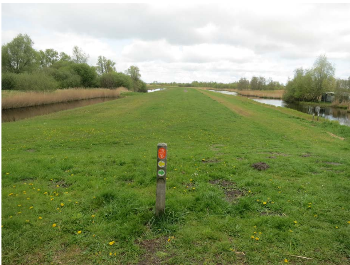
Grasdijk aan de oostkant bij Den IJp en Landsmeer.

af komen. Het Twiske is echter bovenal een heerlijk wandelgebied. We gingen er de Honderd Morgenroute lopen, een prachtig, ongeveer zeven kilometer lang ommetje aan de noordoostkant van het gebied, dat we betreden vanuit Den IJp. Als u met de auto komt wel even 3,5 euro betalen. Het Twiske is namelijk met slagbomen en camera's afgesloten om criminaliteit en vandalisme te voorkomen en is tussen 23.00 en 06.00 uur voor de auto niet toegankelijk. Voor dat geld krijg je wel wat terug! Heerlijke (half)verhard paden leiden ons door lentegroene loofbossen, langs uitgestrekte rietvelden en mooie, weidse terreinen. Ze worden voor een deel verhuurd aan boeren die er vleeskoeien laten grazen. We lopen aanvankelijk parallel aan de woningen van Den IJp en Landsmeer, die vaak zo fraai zijn dat ze het uitzicht op geen enkele manier verstoren.