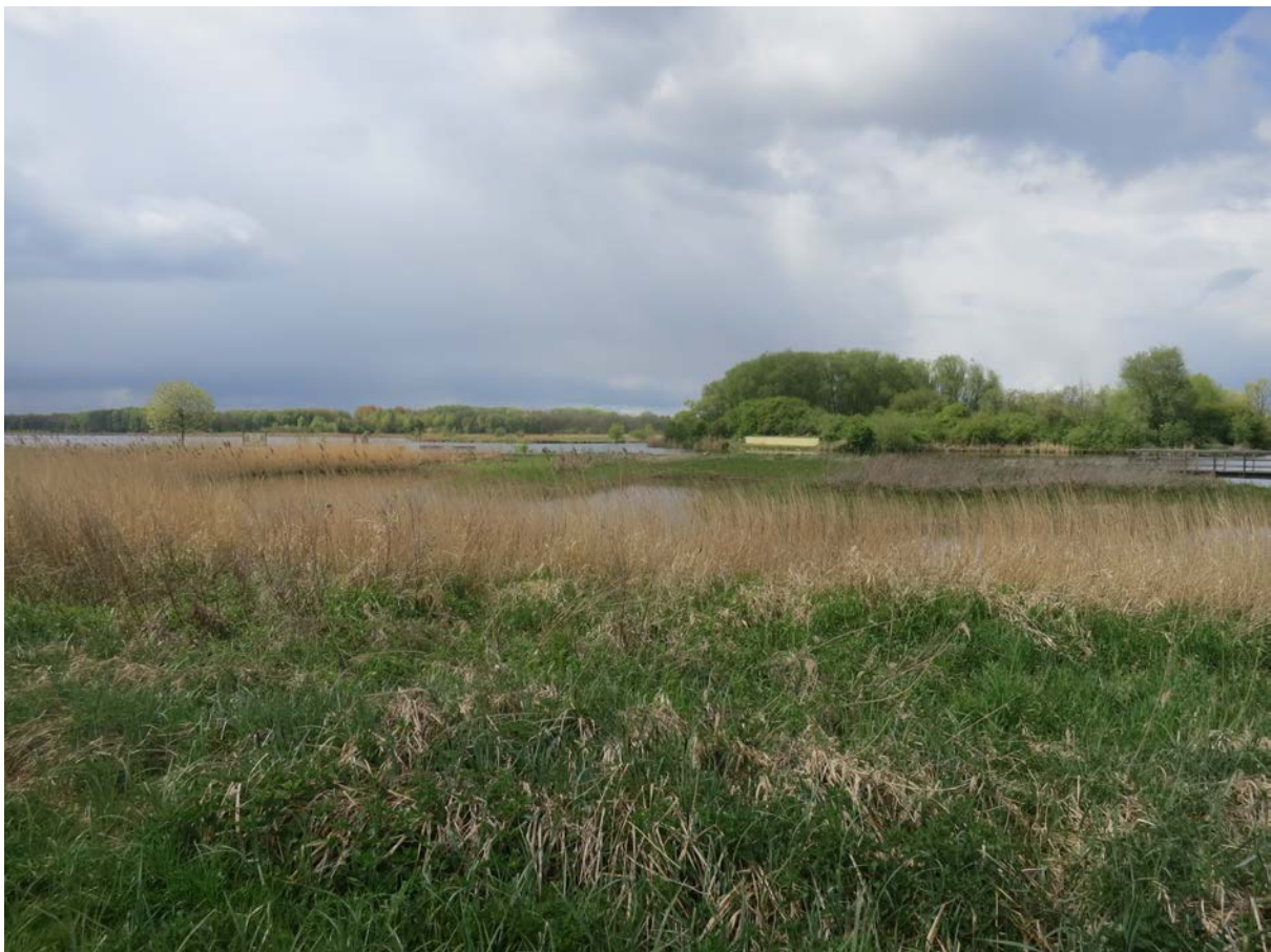
Uitgestrekte rietvelden met mooie, dreigende Hollandse lichten.

Z o'n honderd jaar geleden was Het Twiske, dat zijn naam dankt aan het oude veenriviertje dat vanuit de huidige Wijdewormer naar het recreatiegebied stroomde, al geliefd bij watersporters en beroemde natuurliefhebbers als Jac. P. Thijssen. Hij sprak zelfs over 'het rijk der duizend eilanden' . Net als op het Naardermeer had echter ook Amsterdam zijn oog laten vallen op het gebied om er zijn vuilnis te storten. Door de slechte bereikbaarheid koos men gelukkig uiteindelijk voor een vuilverbrandingsinstallatie en kon Natuurmonumenten beginnen met het aankopen van percelen. In die tijd verdienden mensen in de lintdorpen Oostzaan, Den IJp en Landsmeer hun geld vooral nog met het houden van pluimvee en eenden, waarvan de eieren werden gebruikt in de Zaanse beschuitindustrie.