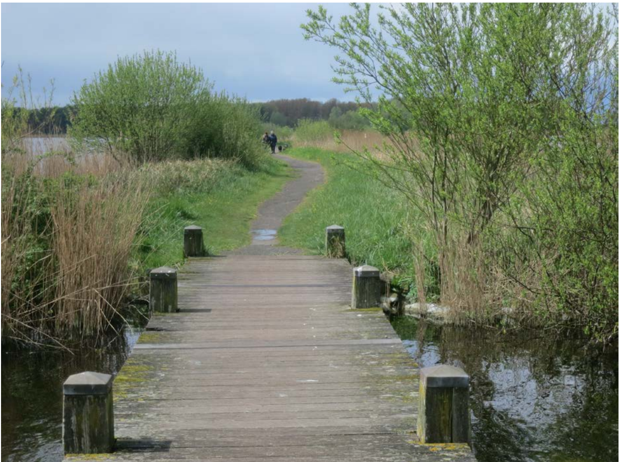
De vlonders over de Stootersplas kan je niet links laten liggen.

Omdat iets verder de vlonders over de plas er zo verleidelijk uitzien, laten we de gele pijlen even los en wandelen we over het hout langs het Kure Jan Strand naar routepaal 14 waar we de gele route weer oppakken. Links zie je een broedwand waar oeverzwaluwen elk jaar speciaal voor uit Afrika komen overvliegen. De Stootersplas, op sommige plaatsen wel 40 meter diep, is geliefd bij vissers en duikers die zich in het heldere water helemaal kunnen uitleven. Men heeft speciaal voor hen zelfs twee duikplatforms laten afzinken. In het water eenden, ganzen en smienten, terwijl je boven het bos buizerds en de rietvelden bruine kiekendieven kunt zien zweven. Als we bijna terug zijn, passeren we de Speelsloot waar wat kleinere kinderen heerlijk kunnen spelen met allerlei waterspeeltjes. Gelukkig maar dat Amsterdam geen vuilnisbelt van Het Twiske heeft gemaakt!