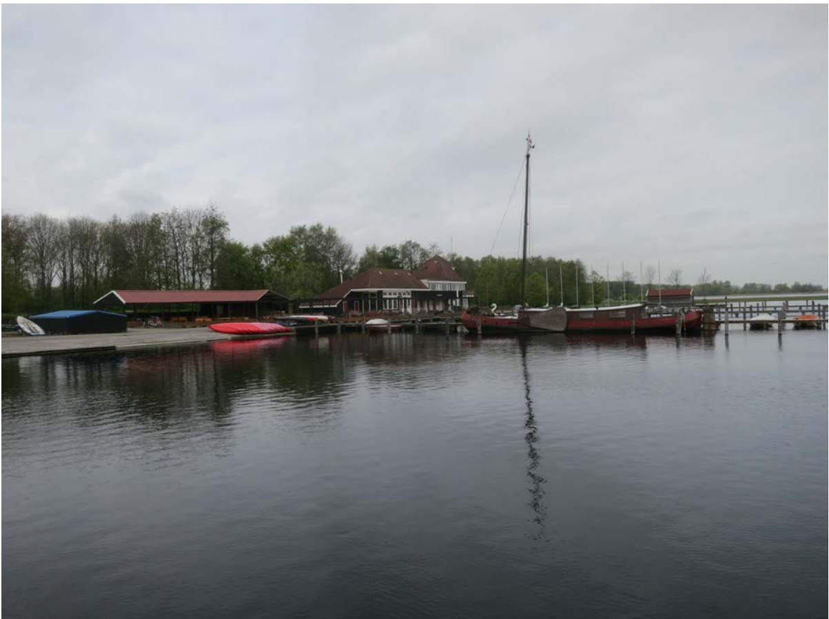
Twiske Haven waar je zeilboten en kano's kan huren.

N a een aantal kilometers stuiten we op een kudde Schotse Hooglanders die het gebied begrazen. Stier Kees heeft hier een leven als een sultan: zijn harem heeft dan ook weer voor een flink aantal nakomelingen gezorgd. Peetmoeder van de harem is Ellen, met haar 23 jaar de oudste van het stel en inmiddels moeder van twaalf kinderen. De kalfjes worden na een zwangerschap van 9 maanden geboren tussen januari en juni. Ze krijgen zelfs internationale belangstelling van een groep Engelse vrienden die elk jaar ergens anders samen gaat fietsen. Verderop komen we weer bij de Stootersplas, waar we aan de overkant de Avonturenspeelplaats – geweldig voor kinderen!- en Twiske Haven zien. Je kunt er zeilboten en kano's huren en in restaurant Twiskehaven genieten van een hamburger die is gemaakt van puur hooglandervlees. Jawel, van de kudde die we net hebben bewonderd. Geniet ervan en onthoud dat ze een heerlijk, vrij leven hebben gehad.