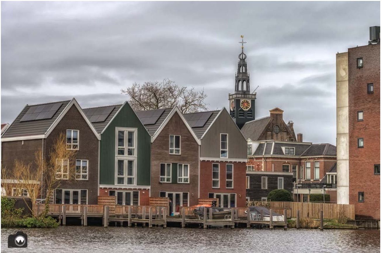
- Huizen aan de overkant met op de achtergrond de Bullekerk. -

We lopen langs “De Fabriek” een historisch gebouw waarin een filmtheater en een café-restaurant zijn gevestigd. Vroeger was het een jongensschool. De naam “De Fabriek” is een grapje omdat het pand juist géén fabriek was en de meeste andere panden aan de Zaan wel.