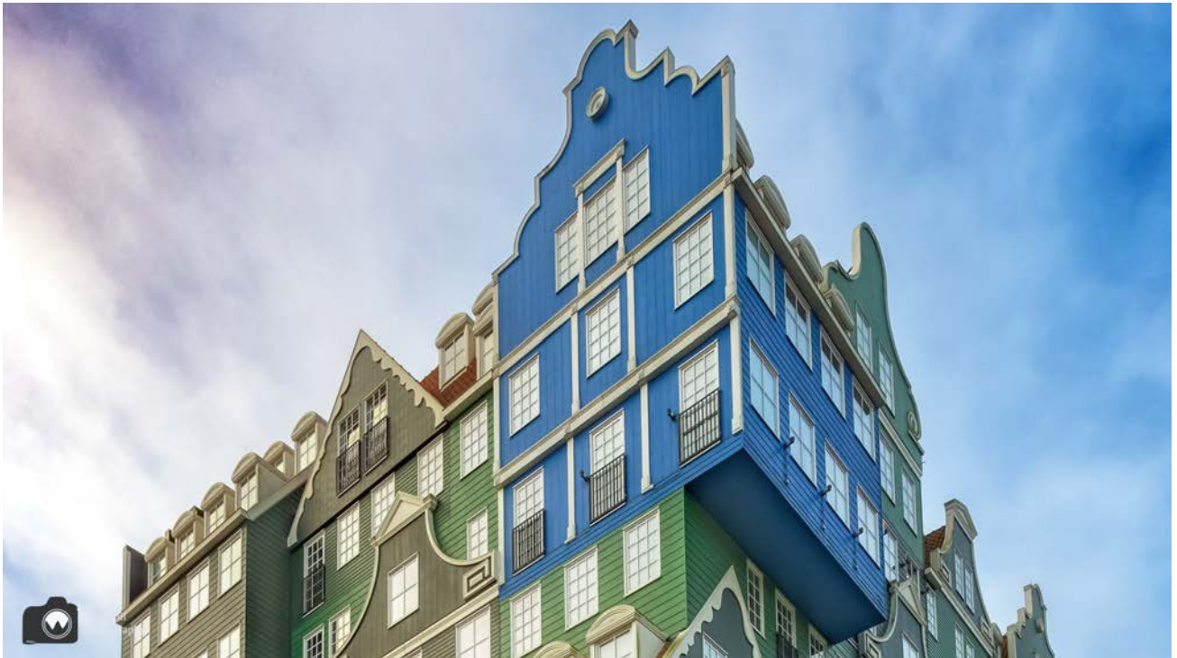
- Detail van Hotel Inntel. -