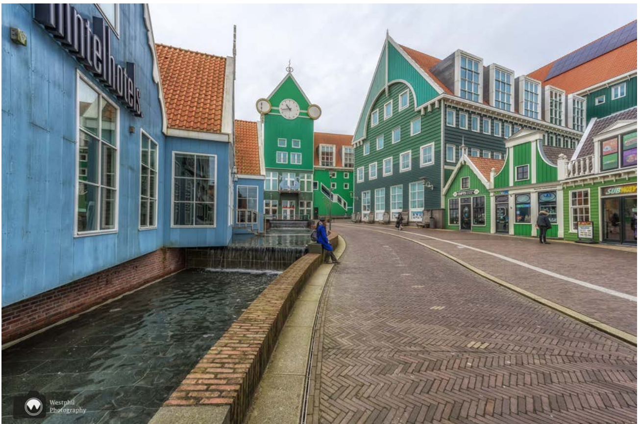
- Het Stadhuisplein. -