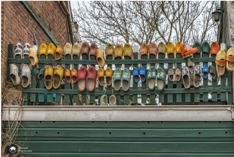
- Op de Hogendijk verzamelt iemand klompen. -

Je kunt de route nog leuker maken door in de Symon Claeszstraat na de school linksaf te slaan de Bloemgracht op. Aan het einde van deze straat is de Sint-Bonifatiuskerk. Loop daar naar rechts en volg de blauwe pijlen langs de Oostzijde. Volg de Oostzijde totdat je aan je linkerhand een parkeerterrein ziet (de Werf) en loop vanaf daar naar links naar het water. Wandel dan via de steiger terug naar de Beatrixbrug en pak daar de pijlen weer op.