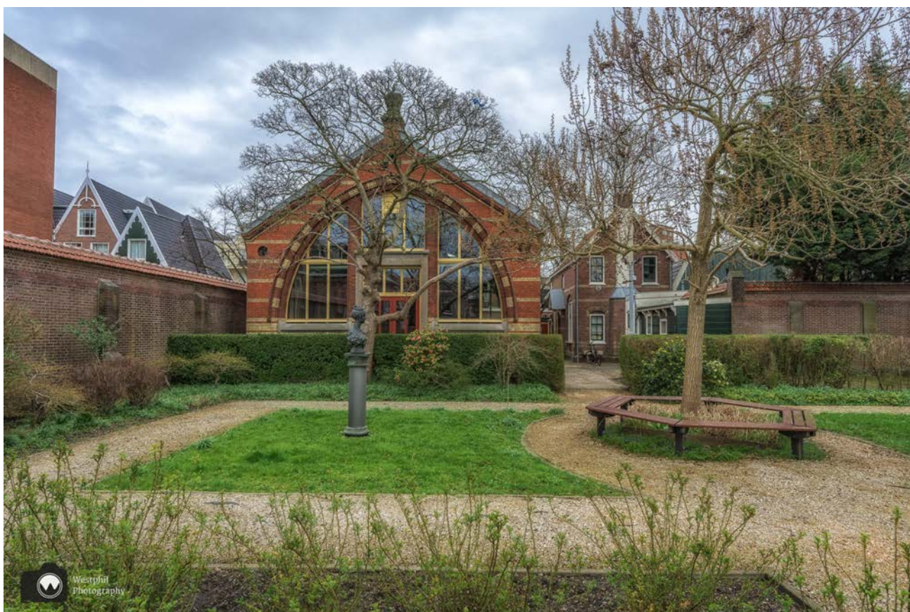
- De tuin en de overkapping van het Czaar Peterhuisje. -

Vanaf hier kun je een mooie foto maken van de overkapping van het Czaar Peterhuisje. Daarna wandelen we weer braaf achter de blauwe pijlen aan.