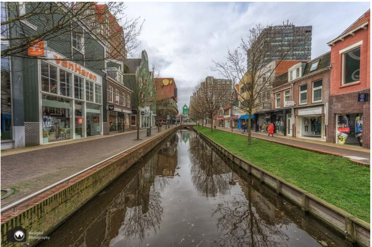
- De Gedempte Gracht, die niet meer zo gedempt is. -

Je kunt op twee manieren de Gedempte Gracht oplopen, met de roltrap naar beneden, of gewoon rechtdoor. Het is nog lekker rustig omdat wij de wandeling op zondagochtend doen.