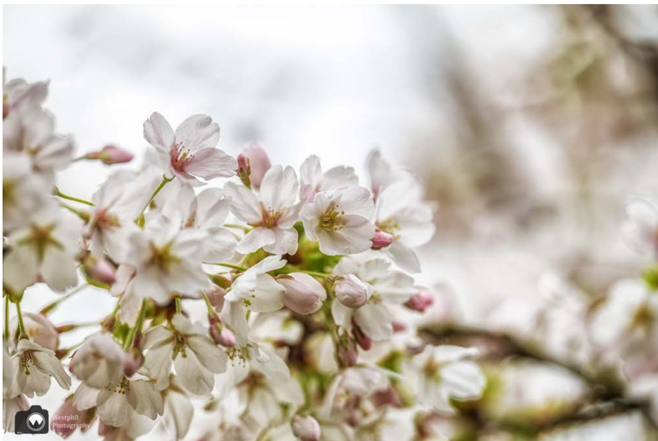
- De sierkers staat op het moment prachtig in bloei. -

Bij de Zuidervaldeurstraat slaan we linksaf en lopen rechtdoor bij Het Dok de steiger op.