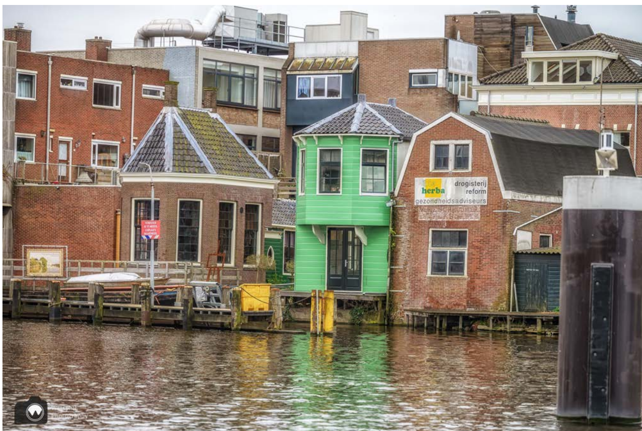
- In en achter het groene huisje is het Monetatelier gevestigd. -

Het is de bedoeling dat er een Street Art route in Zaandam komt. Meer info hierover lees je hier . Als je het atelier wil bezoeken, dan moet je van de route afwijken.