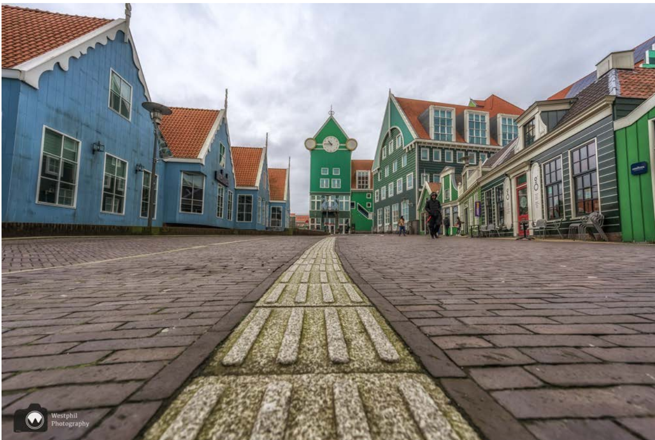
- De wandeling eindigt op het Stadhuisplein. -