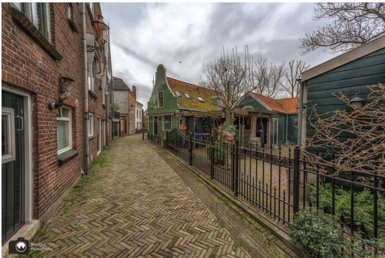
- De Lage Horn. -