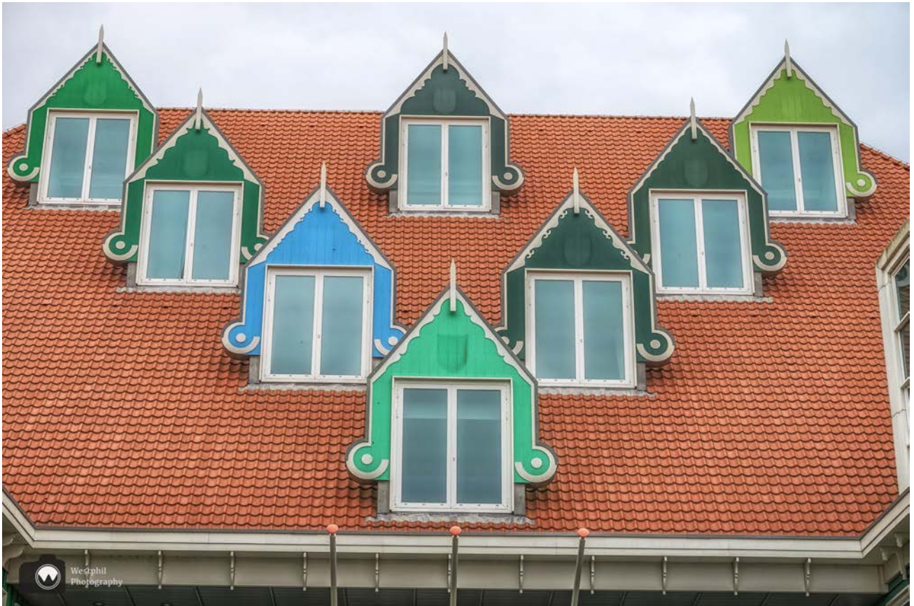
- Tot onze grote schrik ontbreken nu de wapenschilden. -

Hotel Inntel is ontworpen door Wilfried van Winden. De buitenkant van het hotel bestaat uit een opeenstapeling van bijna zeventig losse Zaanse huisjes in vier kleuren Zaanse groen. Eén huisje is blauw. Dit huisje is een verwijzing naar het schilderij La Maison Bleue van Monet. In 1871 verbleef de kunstschilder Claude Monet vier maanden in de Zaanstreek. Hij liet zich inspireren door de Zaanse huisjes, molens, het veenweidelandschap en de boten op de Zaan.