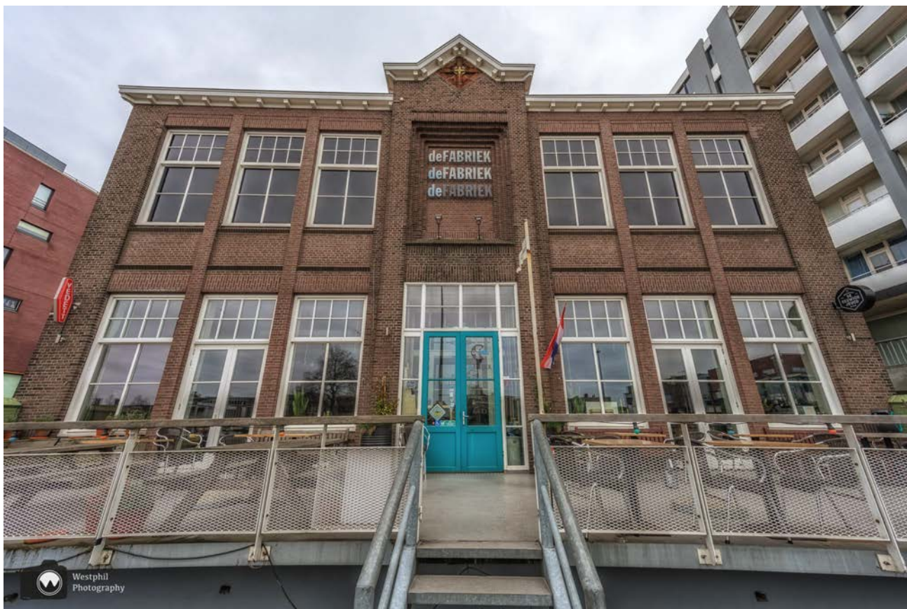
- "De Fabriek", die eigenlijk nooit een fabriek is geweest. -