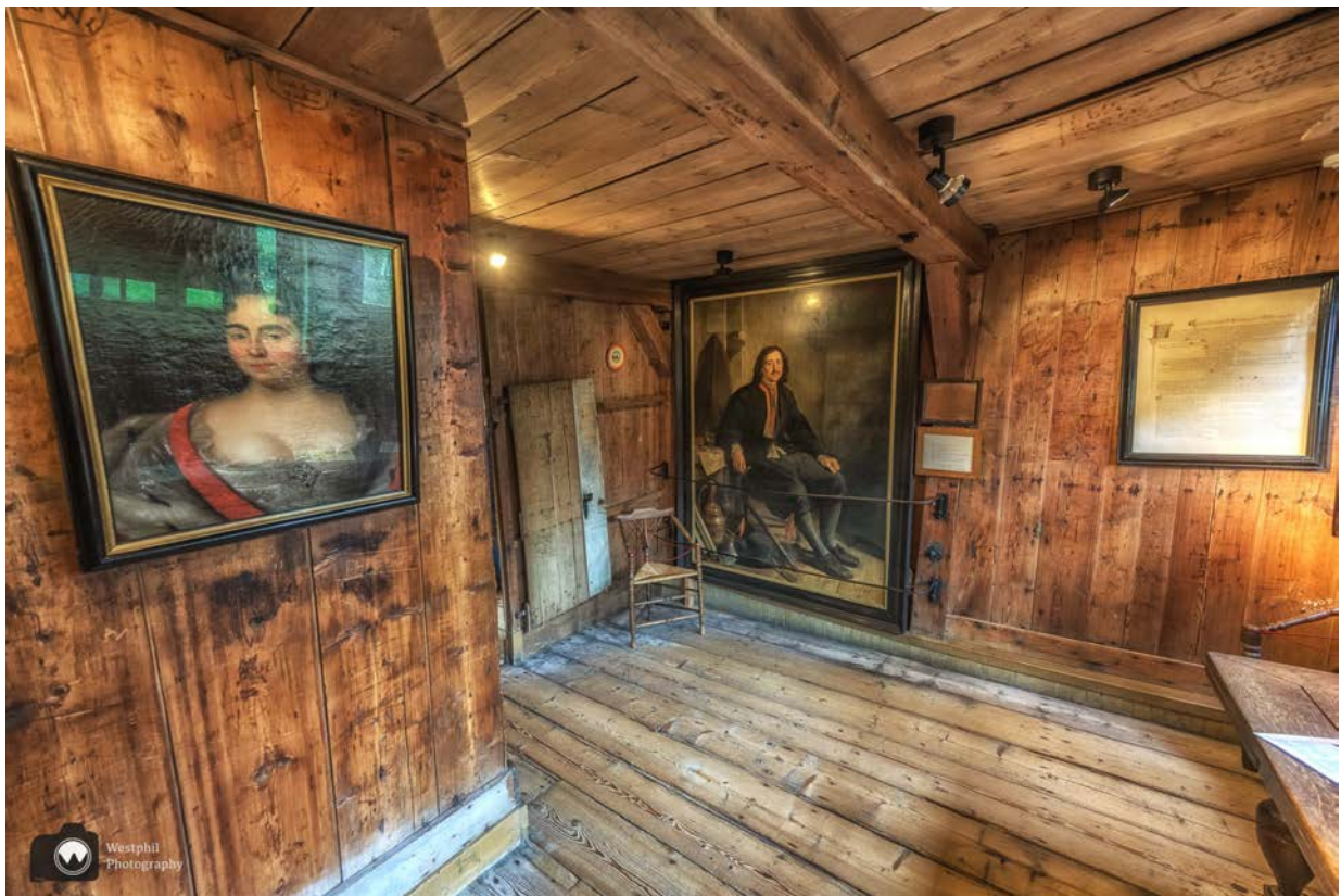
- Nog eentje van het Czaar Peterhuisje. -

We volgen de pijlen en komen uit onder het Stadhuis. Je kunt langs of door de wachtruimte van het busstation lopen. Als we met de trap omhoog gaan zijn we weer op het Stadhuisplein aanbeland. We besluiten te lunchen bij Hotel Inntel, omdat je er lekker kunt eten en het er altijd zo heerlijk rustig is. Op het toilet komen we de portretten van Czaar Peter en Czarina Catharina weer tegen.