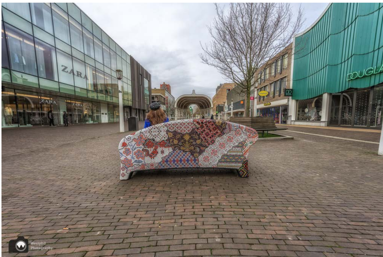
- Social Sofa met de landkaart van Oekraïne. -