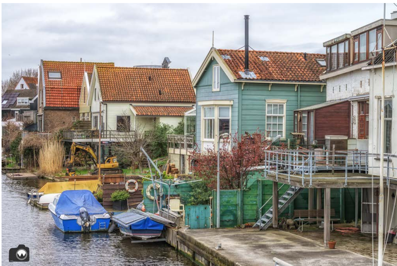
- Heerlijk om zo aan de Zaan te wonen. -