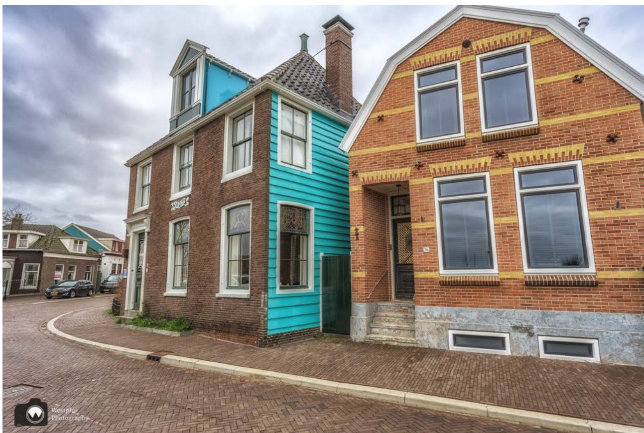
- Het Blauwe Huis. -

Langere tijd bestond er twijfel of de helder blauwe kleur die Monet op het schilderij aan het huis heeft gegeven echt was, of een artistieke vrijheid van de kunstschilder. Toch heeft nader onderzoek naar de originele houten planken van de gevel uitgewezen dat het huis echt blauw was in 1871.