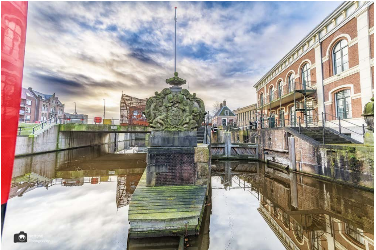
- Links de Wilhelminasluis en rechts de Honsbossche Sluis. -

Op de sluis staat een huisje van Cortenstaal. Dit sluishuisje is een ode aan het veenweidelandschap en de Zaan. De gevel bestaat uit een ajour uitgesneden landkaart uit 1812 van Zaandam. Als het donker is wordt het verlicht en werkt het huisje als een lantaarn.