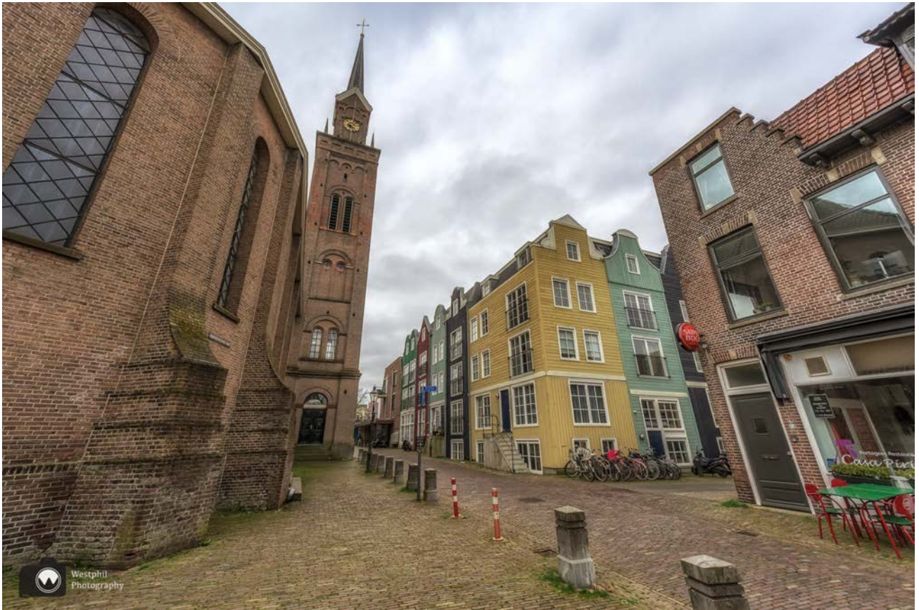
- Door de groothoek lijkt de kerk een beetje scheef, maar dat is niet het geval. -

De Klauwershoek was een van de eerst bewoonde gebieden van het vroegere Oostzaandam. De terp was reeds in de 14e eeuw bewoond. In 1411 werd een kapel op de terp gebouwd, die later werd vervangen door de Oostzijderkerk. De naam herinnert aan de 'klauwers', de vaklieden die de naden in de scheepsdekken en -wanden dichtten.