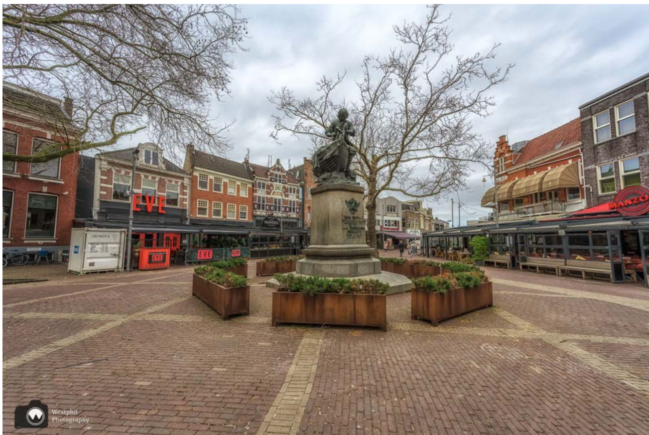
- Het standbeeld van Czaar Peter. -

Op de Dam zijn heel veel leuke restaurants om te lunchen of te dineren. Voor ons is het nog een beetje te vroeg. We maken nog een foto van het beeld van Czaar Peter. “Czaar Peter I Leert den scheepsbouw in Zaandam” staat er onder.