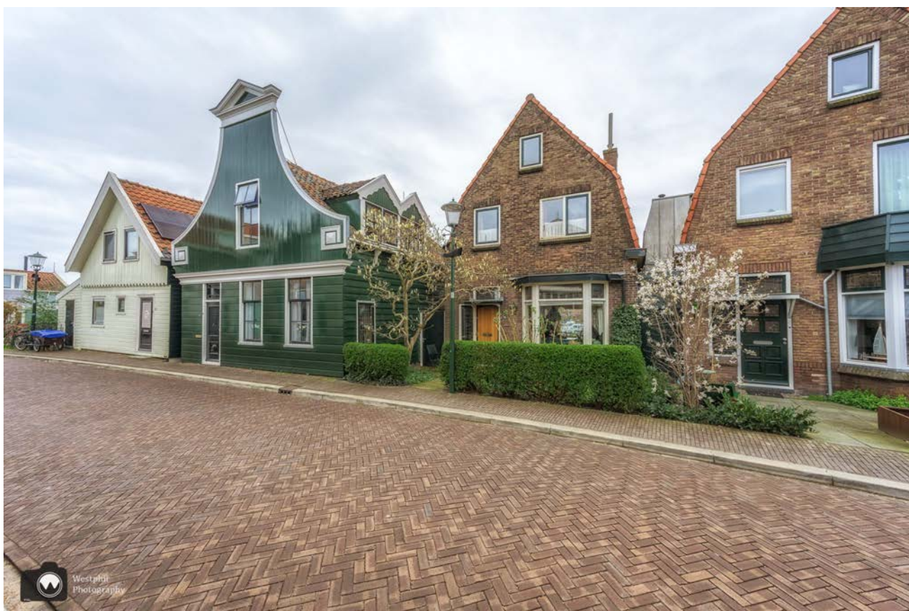
- Huizen op de Hogendijk. -

We lopen langs oude en nieuwe huizen, langs een oude sluis en het Gemaal Soeteboom. Het gemaal wordt nu alleen nog gebruikt om sloten door te spelen.