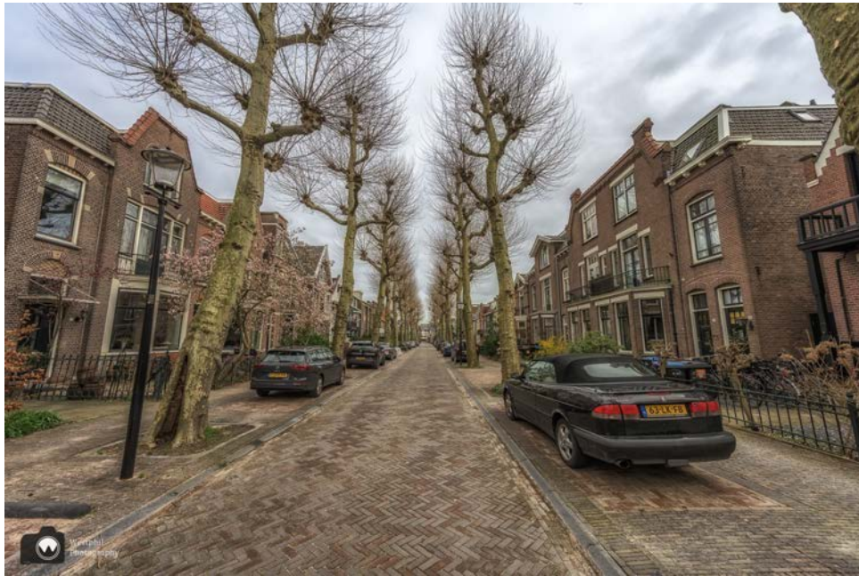
- De Botenmakersstraat. -