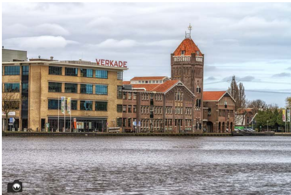
- De Verkade fabriek -

We zien rechts de Verkadefabriek, waar tegenwoordig de bibliotheek, een restaurant diverse winkels en een centrum voor de kunsten in gevestigd is. Links zien we de Bullekerk, die boven de huizen uitsteekt.