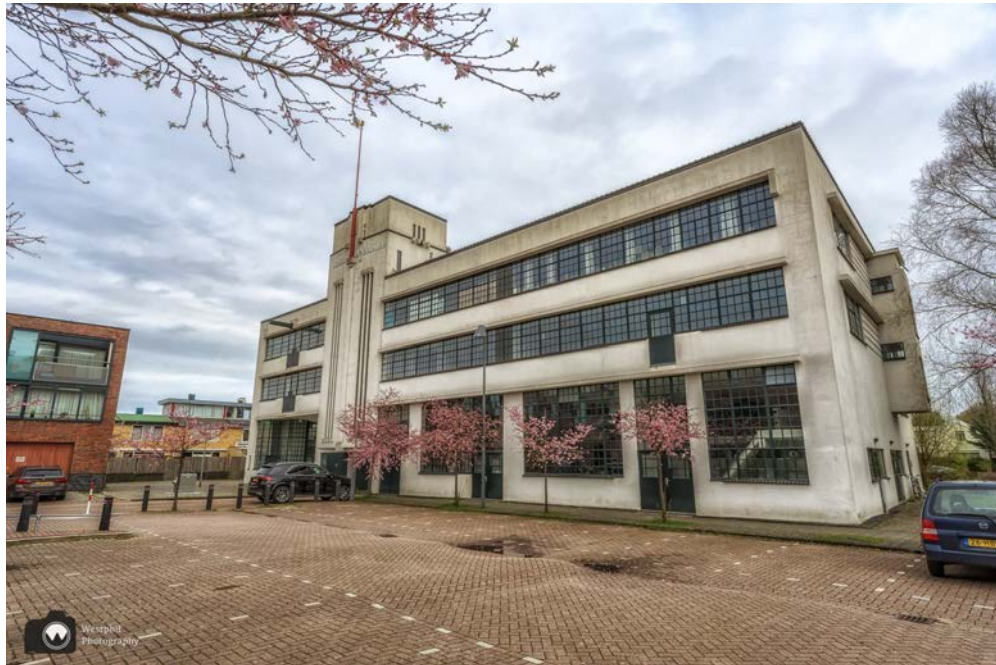
- Maison Essence. -

Aan het einde van de Botenmakersstraat lopen we een bruggetje over en zien aan onze linkerhand Maison Essence.