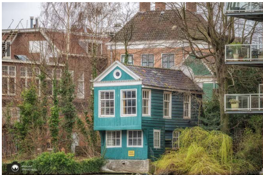
- Nog een prachtig huisje aan de Westkant van de Zaan. -

Je kunt de route nog leuker maken door in de Symon Claeszstraat na de school linksaf te slaan de Bloemgracht op. Aan het einde van deze straat is de Sint-Bonifatiuskerk. Loop daar naar rechts en volg de blauwe pijlen langs de Oostzijde. Volg de Oostzijde totdat je aan je linkerhand een parkeerterrein ziet (de Werf) en loop vanaf daar naar links naar het water. Wandel dan via de steiger terug naar de Beatrixbrug en pak daar de pijlen weer op.