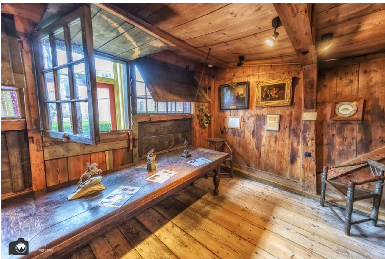
- Een huisje in een huis. -

Het Czaar Peterhuisje is één van de oudste huisjes van Nederlandse houtbouw en is sinds 1823 ter bescherming overkapt door een stenen museumhal.