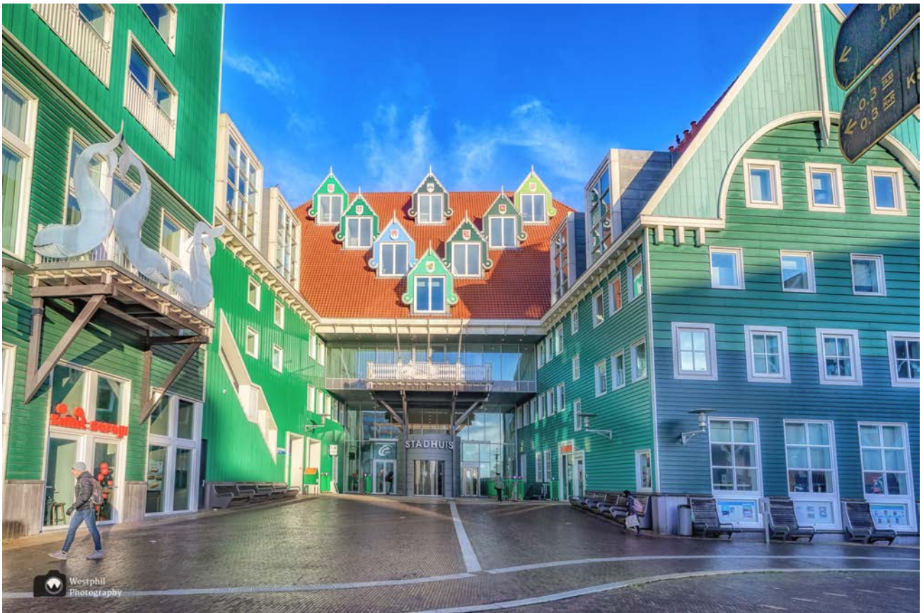
- Het stadhuis met op de dakkapellen de wapenschilden van de gemeenten die samen de gemeente Zaanstad zijn geworden (foto is van een ander jaar). -

We lopen de trap op langs het station, via de brug over het spoor en komen uit bij het Stadhuisplein. Het Stadhuis en hotel Inntel vallen meteen op. Ik dacht altijd dat beide van dezelfde architect waren, maar dat is niet zo.