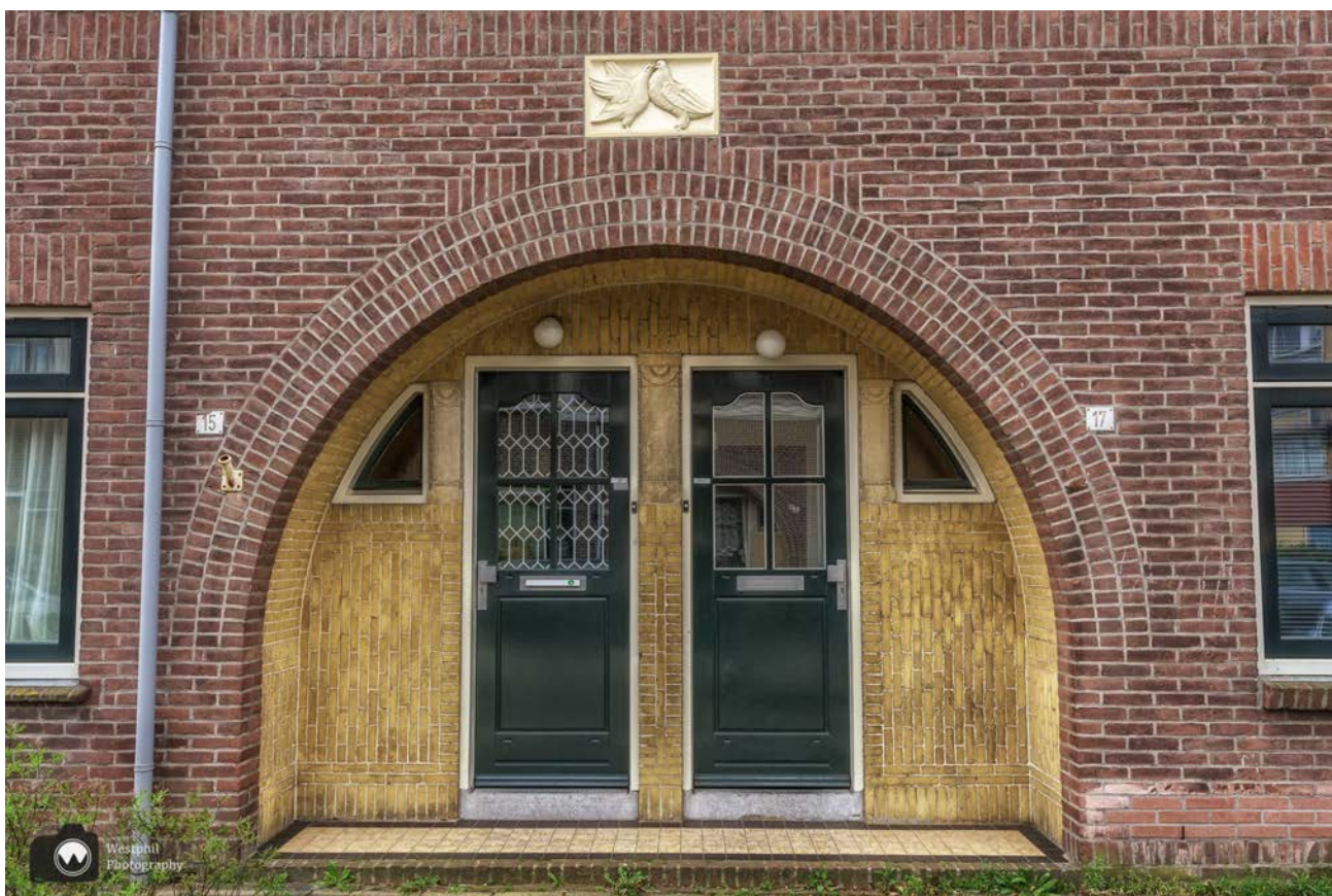
- Portiek in Amsterdamse school achtige stijl. -