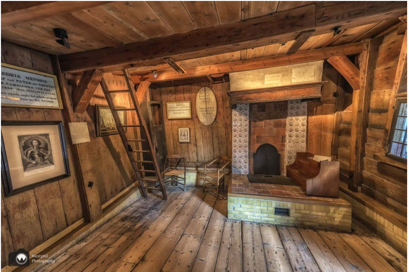
- Niet te geloven dat een man van 2 meter hier zijn hoofd niet stootte. -