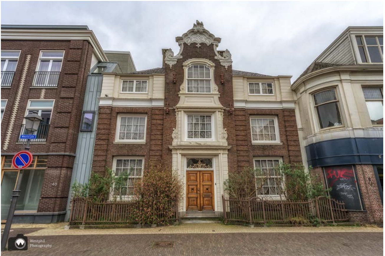
- Het Calff-huis in de Westzijde. -