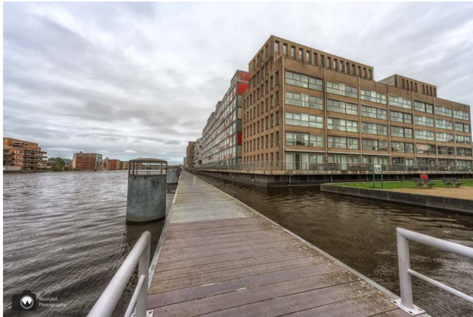
- Zo leuk om over de Zaan te lopen. -

We zien rechts de Verkadefabriek, waar tegenwoordig de bibliotheek, een restaurant diverse winkels en een centrum voor de kunsten in gevestigd is. Links zien we de Bullekerk, die boven de huizen uitsteekt.