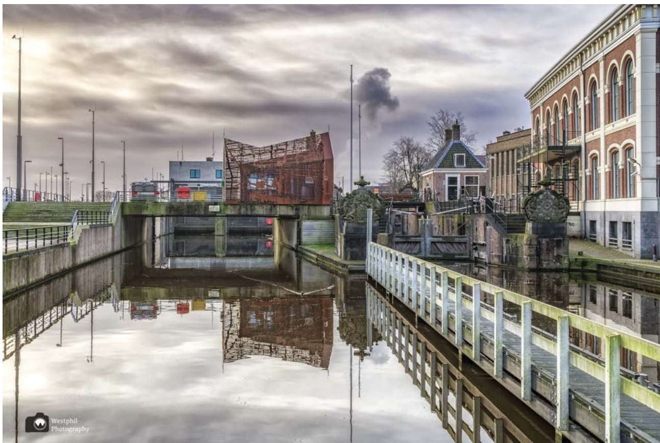
- Het sluishuisje van Cortenstaal. -

Na dit alles bezichtigd en gefotografeerd te hebben wandelen we weer verder over de Dam richting de Westzijde.